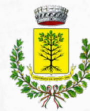
COMUNE DI SPIGNO