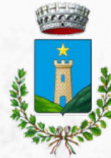
COMUNE DI SS. COSMA E DAMIANO