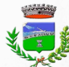
COMUNE DI VENTOTENE